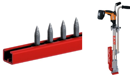
Atornilladora EJOFAST® JF disponible para alquiler.