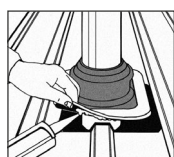
3. Aplicar compuesto sellante.