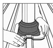
4. Ajustar DEKTITE® a la forma de la chapa perfilada.