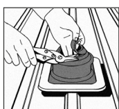
1. Ajustar DEKTITE® al tubo.

Use remaches Bulbtite en cubiertas de fibrocemento ondulado. Altura máx. chapa = 45 (mm)