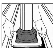
2. Ajustar DEKTITE® a la chapa perfilada y marcar.